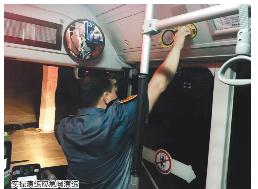
实操演练应急阀演练