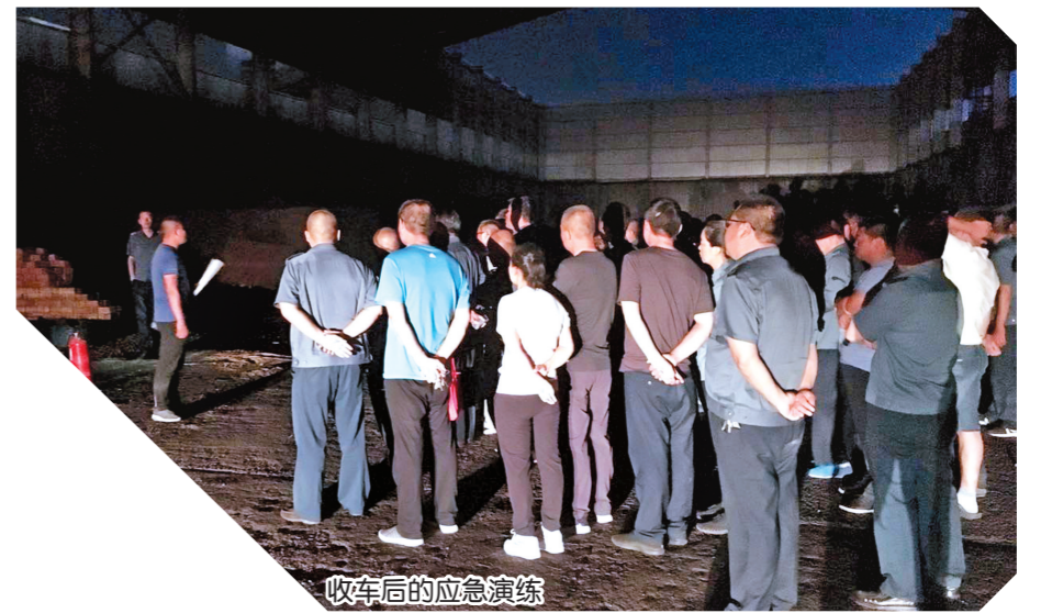
收车后的应急演练

强化安全意识,筑牢生产防线。安全生产工作始终坚持职责明确的原则,确保每个部门、岗位的安全工作都“有人抓、有人管”,以安全生产检查常态化为“灭火器”,消除安全隐患,为建设市民满意的公交服务而不懈努力。