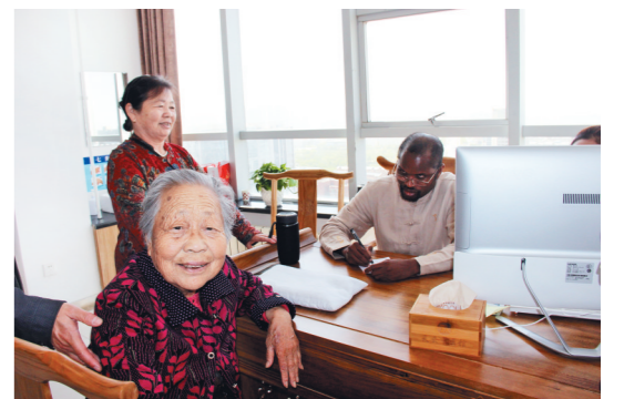
专家迪亚拉为老人开处方